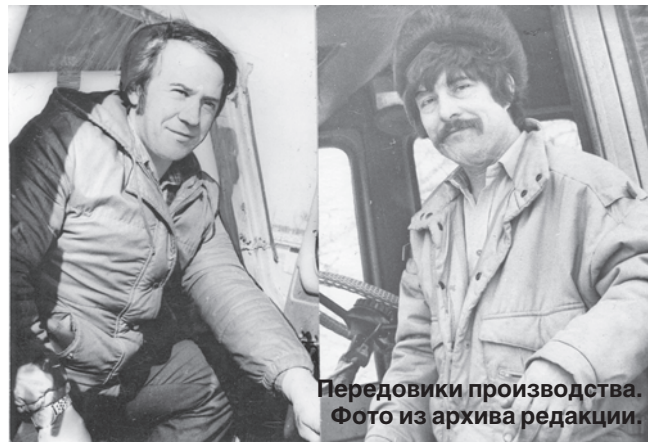
Передовики производства.

- Алексеевич! Ключ никак не подходит, - доносится